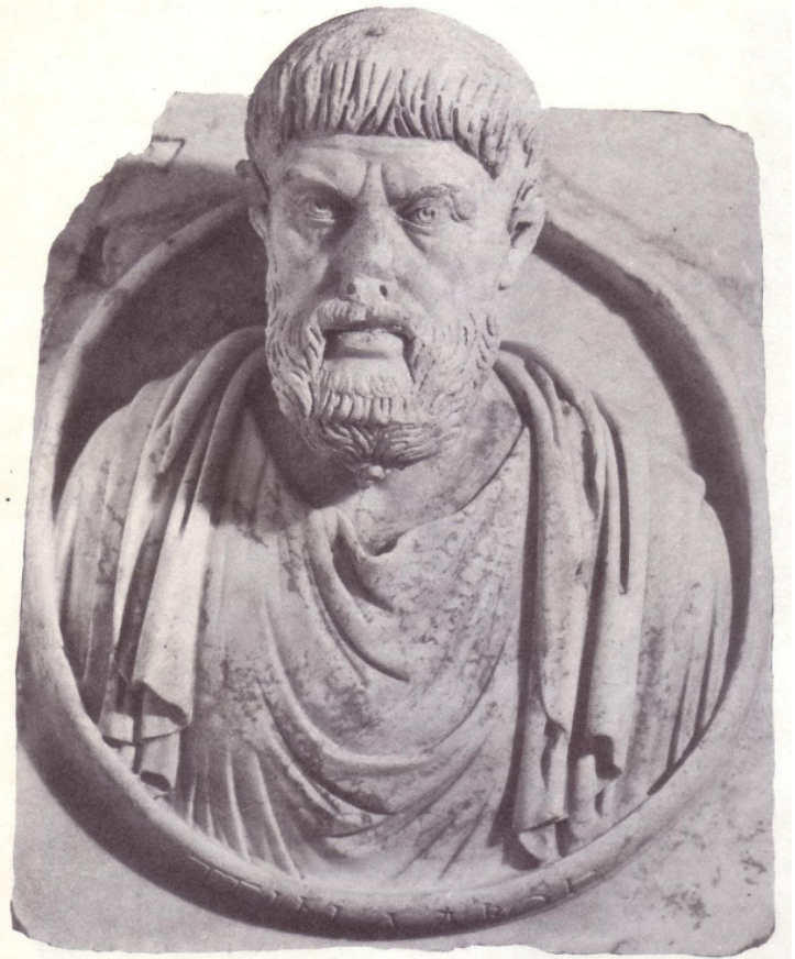
Abb. 3: Pindartondo aus Aphrodisias

zur überlieferten frommen Selbstbescheidung dieses Dichters. Die groben Züge, die Narbe auf dem Kinn sowie auch der eigentümliche Bartknoten, der wohl auf eine alte böotische Mode zurückgeht, legen nahe, dass dieses Porträt wohl noch unter dem unmittelbaren Eindruck des Dargestellten entsprungen ist; es dürfte noch zu Lebzeiten des Dichters, vielleicht als dessen Auftrag entstanden sein. Herausgekommen ist ein Bildnis, das den Dichter als konzentriert blickenden, energischen Mann in reifem Alter von ca. 50 bis 60 Jahren festhält. Dieses Bildnis war ursprünglich sicherlich eine Ganzkörperstatue, die entweder sass oder stand, und die, wie die Herme mit dem Gewandrest anzeigt, ein über die linke Schulter geworfenes Himation trug. Denkbar ist, dass der Dichter in der Linken eine Lyra hielt. Mehr kann hierzu nicht gesagt werden, da sich unser Bildnistypus nicht mit einer in den antiken Schriftquellen beschriebenen Pindarstatue verbinden lässt. Eine dergestalt überlieferte Sitzstatue des Pindar, die auf der Athener Agora zu sehen war, muss auf eine andere, spätere Schöpfung zurückgehen, da für diese eine andere Kopfhaltung und eine Binde überliefert sind, die unser Typus nicht aufweist. Wahrscheinlich haben Pindarbewunderer auch in späteren Zeiten immer wieder neue Denkmäler zu seinen Ehren errichtet – wichtig ist aber die aufgrund unserer Repliken gemachte Folgerung, dass das erste Bildnis bereits während den Lebzeiten dieses großartigen Dichters entstanden ist.