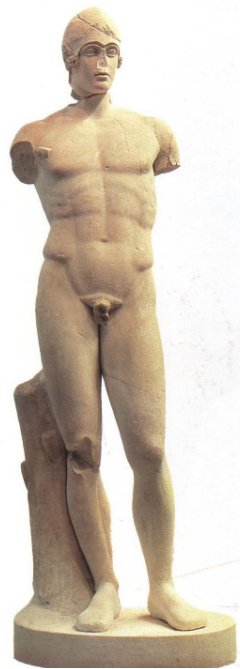
Abb. 3: Zustand nach der Restaurierung von 1966

Unterarm muss nach Ausweis eines Stützenrestes (links von der Brust) erhoben gewesen sein und einen Schild gehalten haben. Diese zu ergänzenden Waffen passen jedenfalls bestens zum Helm. Dieser umspannt den Kopf wie angegossen, wobei die Unterkante des Visiers, genau den Brauenbögen folgt. Bohrlöcher an den Helmseiten verraten, dass hier die ursprünglich separat gearbeiteten Wangenpartien befestigt waren. Hinten am Nacken erscheint unter dem Helm ein Haarschopf. Im Gesicht fallen die scharfkantig abgehobenen Brauen und die großen Augen auf. Die Lippen sind leicht geschwungen und unmerklich geöffnet. Nicht zuletzt wegen dem engen Helm ist die gesamte Kopfstruktur in ein festes und enges Rundoval gepackt, dem gegenüber der Hals und der übrige Körper relativ breit wirken. Die Muskulatur des Rumpfes ist kräftig und in wenige, aber markante Teilformen untergegliedert. Prononciert sind die Rippen, die Bauchmuskulatur sowie der Leistenwulst des Beckens. Die Schamhaare sind zu einer rhombenartigen Eigenform reduziert.