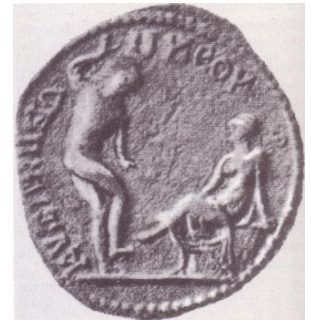
Abb. 3: Rekonstruktion von Klein (1909); Abb. 4: Münze von Kyzikos

Die Fundumstände der meisten Repliken, sowohl des Satyrn wie auch der Nymphe, sind nicht geklärt, es wurde sogar vermutet, dass die Skulpturen als Einzelwerke entstanden sind und nicht unbedingt eine Gruppe gebildet haben dürften. Umso größere Bedeutung kommt neben der Münze aus Kyzikos den unlängst bekannt gemachten Statuenfunden zu, die in den Ruinen des im 1. Jh.n.Chr. erstellten Nymphäums des Laecanius Bassus in Ephesos gemacht wurden, und in denen auch ein Torso des tanzenden Satyrn neben dem der sitzenden Nymphe zum Vorschein gekommen waren, womit die Zugehörigkeit der beiden Statuen zu einer gemeinsamen Gruppe endgültig bestätigt worden ist. Auch die Deutung der «Mänade» als Nymphe bekommt durch den Kontext des Nymphäums ihre Bestätigung.