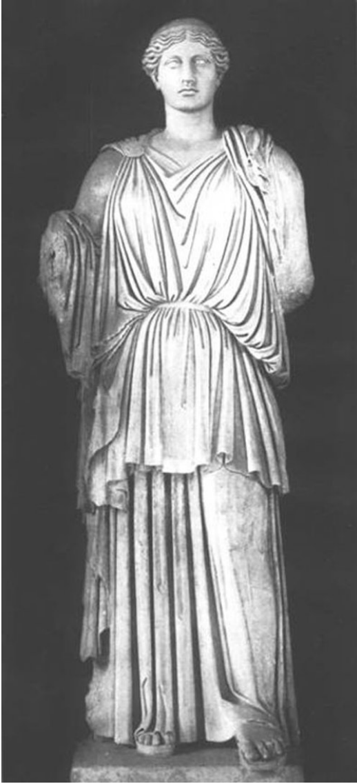
Abb. 2: Hera-Statue aus Ariccia (2. Hälfte 1. Jh. n. Chr.).